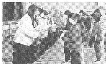
〔交通安全感謝の会〕