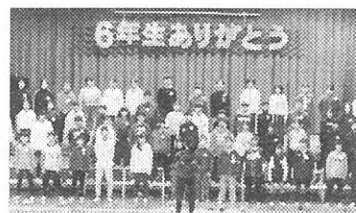
〔6年生ありがとうの会〕